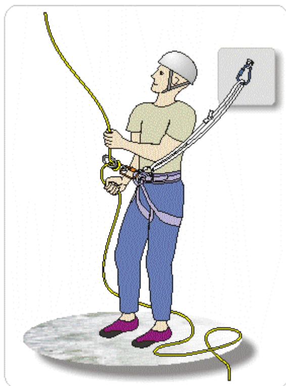
Мал.16.Облаштування самостраховки з основної мотузки.

б. Самостраховка зі стропи. За звичай, самостраховка зі стропи у вигляді петлі є дуже зручною (мал.17), так як стропа легка та надійна, а при потребі її можна використати на інші цілі (наприклад: зав'язати навколо скельного виступа або дерева і налагодити пункт страхування).