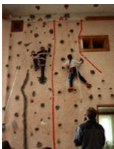
Мал.31.Скельний тренажер на звичайній стіні.

б. Рельєф тренажерів . Макрорельєф скельних тренажерів залежить від їхньої конструкції та місця розташування. Найпростіший тренажер можна збудувати , видовбавши, заглибини в звичайній стіні (мал.31) . Більш функціональні виконують з модулів , які монтуються на каркасі , що відтворює макрорельєф скелі (мал.32) . На них за допомогою болтів прикручують зовнішні або внутрішні зачіпки різноманітної форми (мал.33).