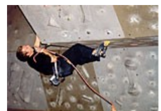
Мал.32.Штучна скеля з модулів.